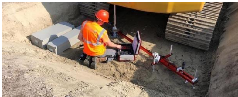
Figuur 1 Test opstelling