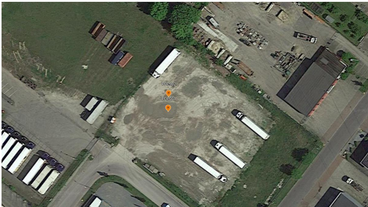
Figuur 2 locatie metingen

Als reactiekracht is een dumper van circa 20 ton gebruikt waarbij het frame als steunpunt is gebruikt.